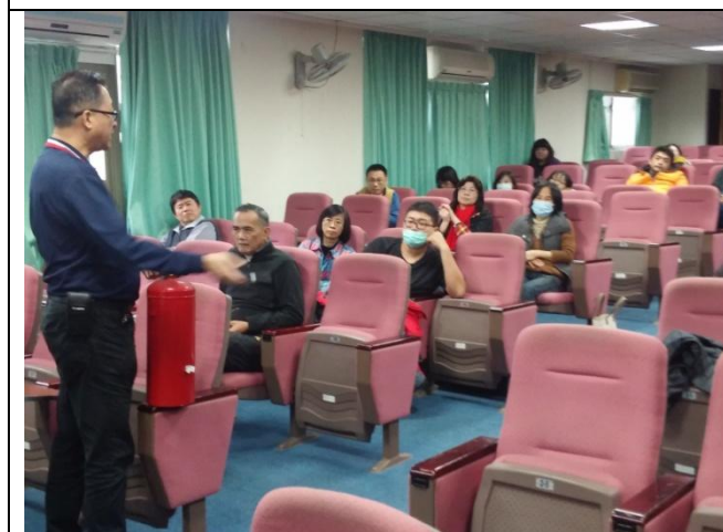
說明：講師示範滅火器的用法