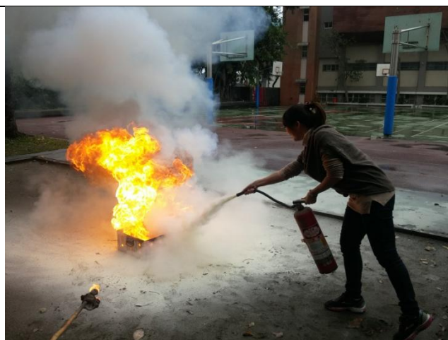
說明：教師實際操作滅火器並了解如何使用