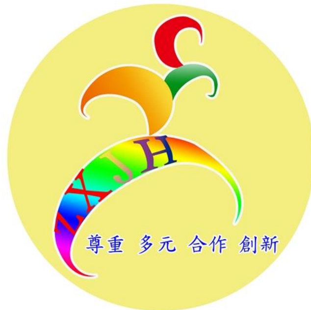
圖一、忠孝國中願景圖像

忠孝國中以「尊重、多元、合作、創新」建構學校的願景，在科技與人文的「全人教育」目標下，成就每一個孩子，並建立學校的特色，讓學生能在校園有效學習、健康成長，營造學生樂在學習的優質學園。