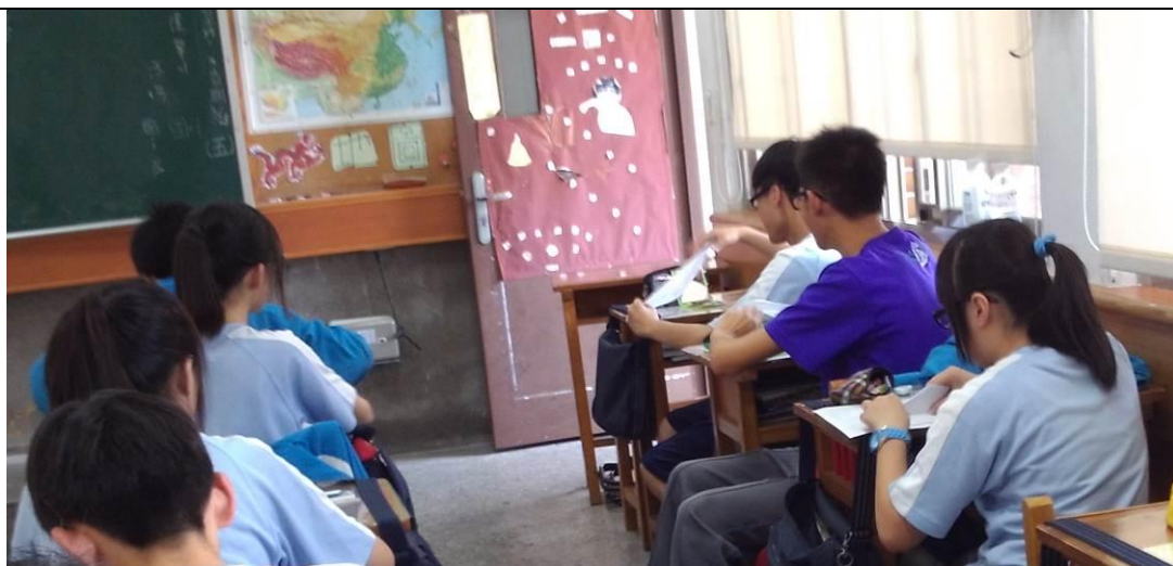
嘗試摺紙飛機的學生