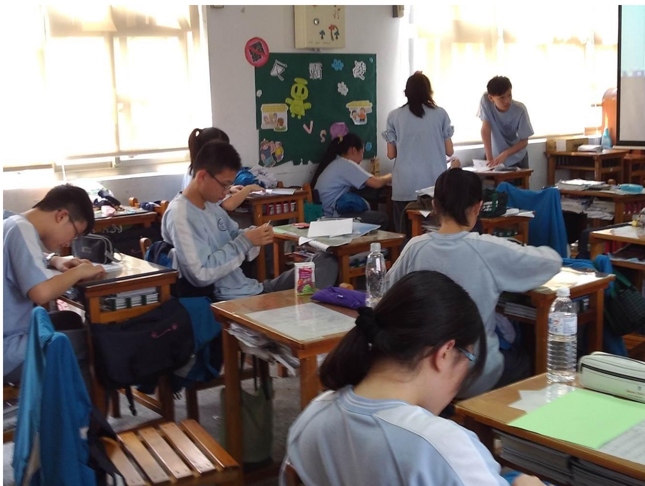
嘗試摺紙飛機的學生，與正在進行交流的學生 教學照片