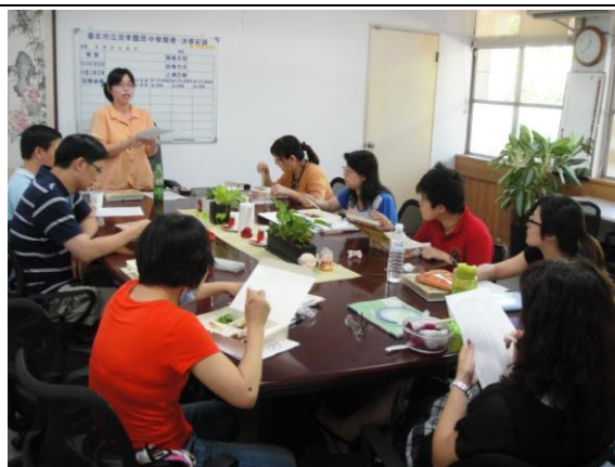
●期初工作分配：教材揀擇、工作分配、議定教學觀摩期程等