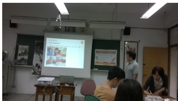
●研習——閱讀融入教學，由校內老師分享自身經驗，可結合課程，亦可以活用晨讀時間。