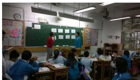
●以四人一組，分組合作，共同解讀文本