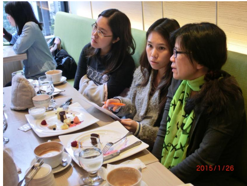
圖說：英語領域教師開會與聚餐