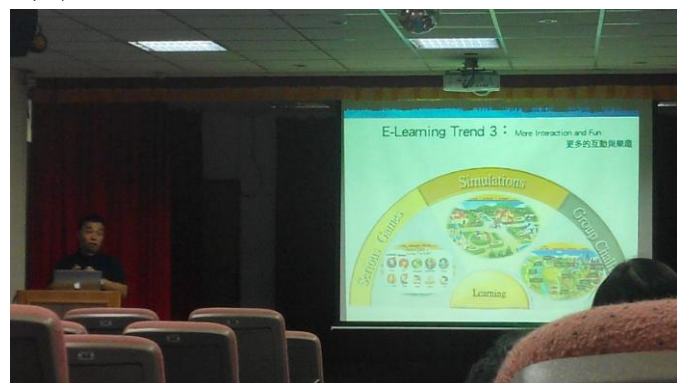
圖說：E-learning Trend 的三個歷程 Serious Game⇒Simulation⇒Group Challenges